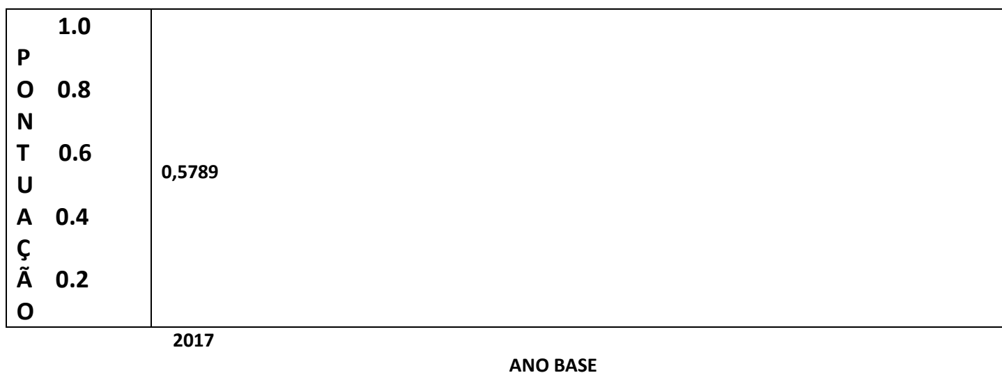
Gráfico de evolução do IDSS

A ANS iniciou, a partir do IDSS ano-base 2017, uma nova etapa do Programa de Qualificação, que usa o Sistema de informação do Padrão TISS (Troca de Informações na Saúde Suplementar) como fonte de dados para o processamento dos indicadores. A metodologia foi totalmente modificada, com os indicadores calculados sobre uma base de dados nova, gerando resultados que não são totalmente comparáveis com os anos anteriores.